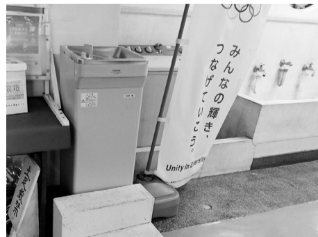
外手小学校に設置された冷水器

また、紙おむつの園内処理については、「やるべき課題として認識している。全保育園のバランスを考えて調整していく」などと答えました。